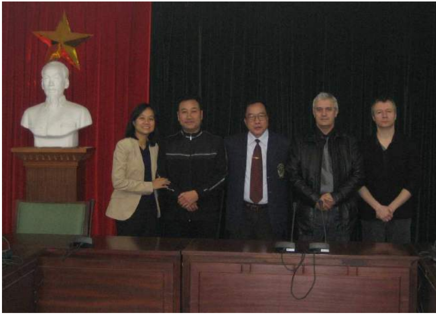
Hà Nội - Comité Olympique