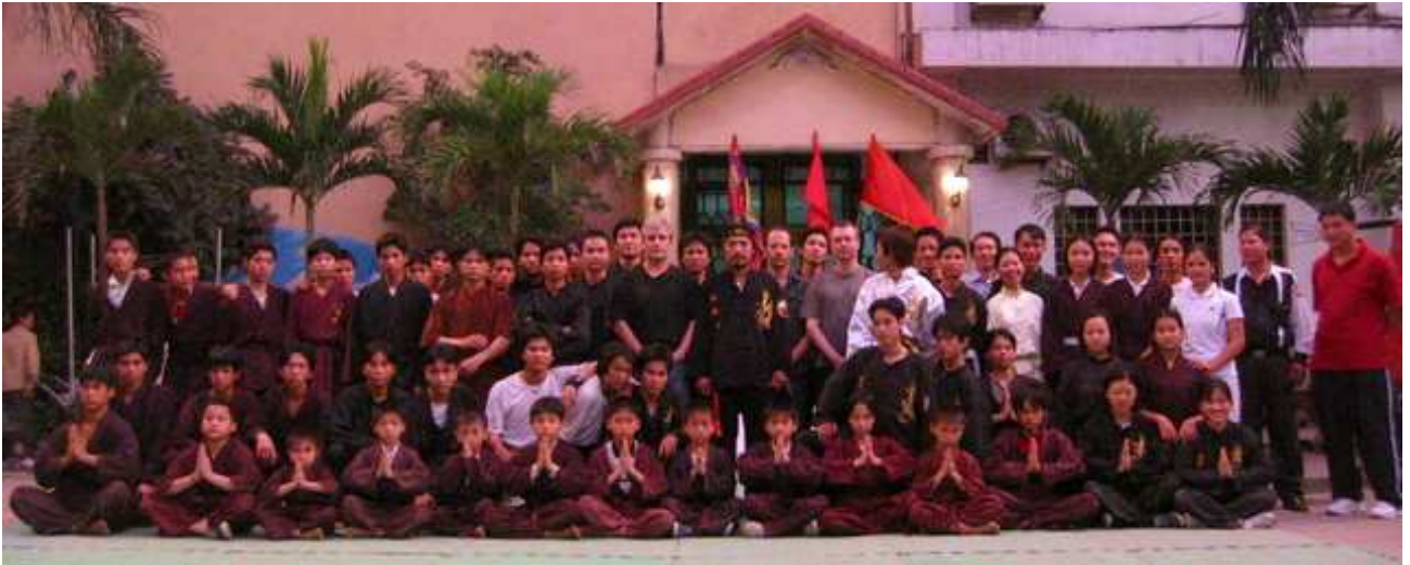
Hà Nội – Avril 2005