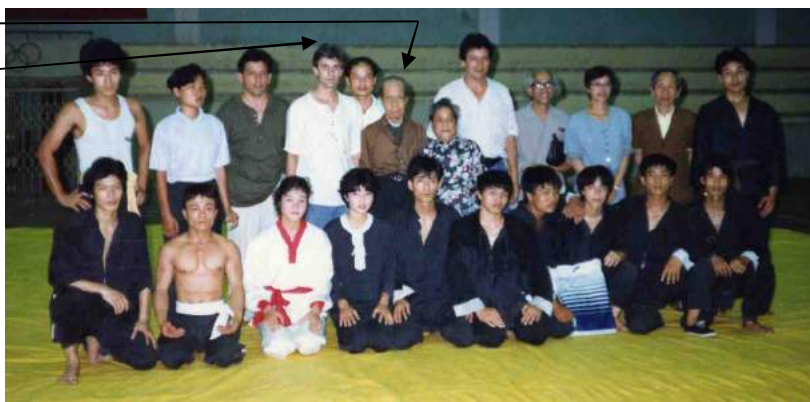
Hà Nội 1991