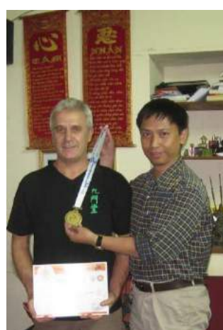
Célébration des 1000 ans de Hà Nội, le 10 Octobre 2010