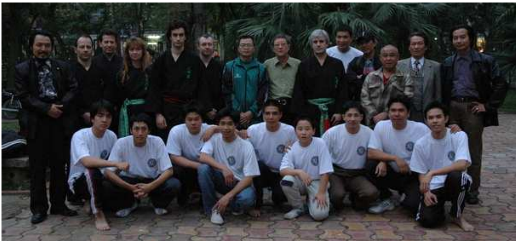
Hà Nội - 2005