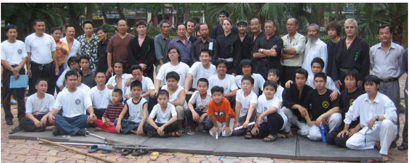
Hà Nội – Avril 2007