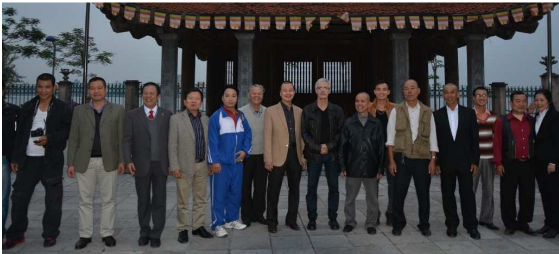
Hà Nội - Unesco - 2015