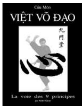
2005 Cửu Môn Việt Võ Đạo, la voie des neuf principes